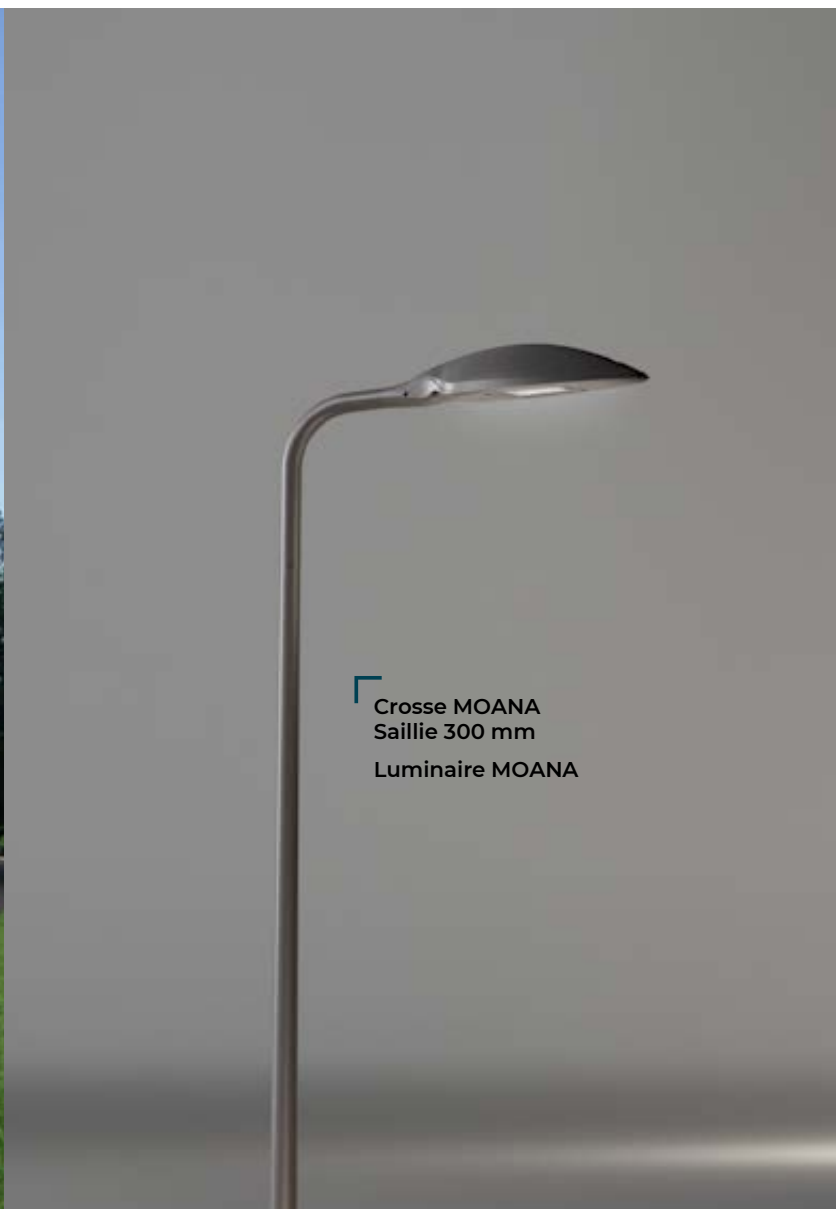
Crosse MOANA Saillie 300 mm Luminaire MOANA