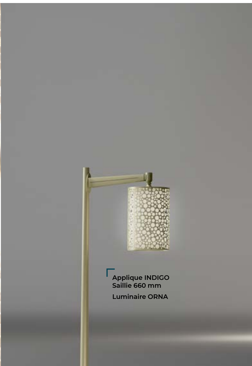
Applique INDIGO Saillie 660 mm Luminaire ORNA