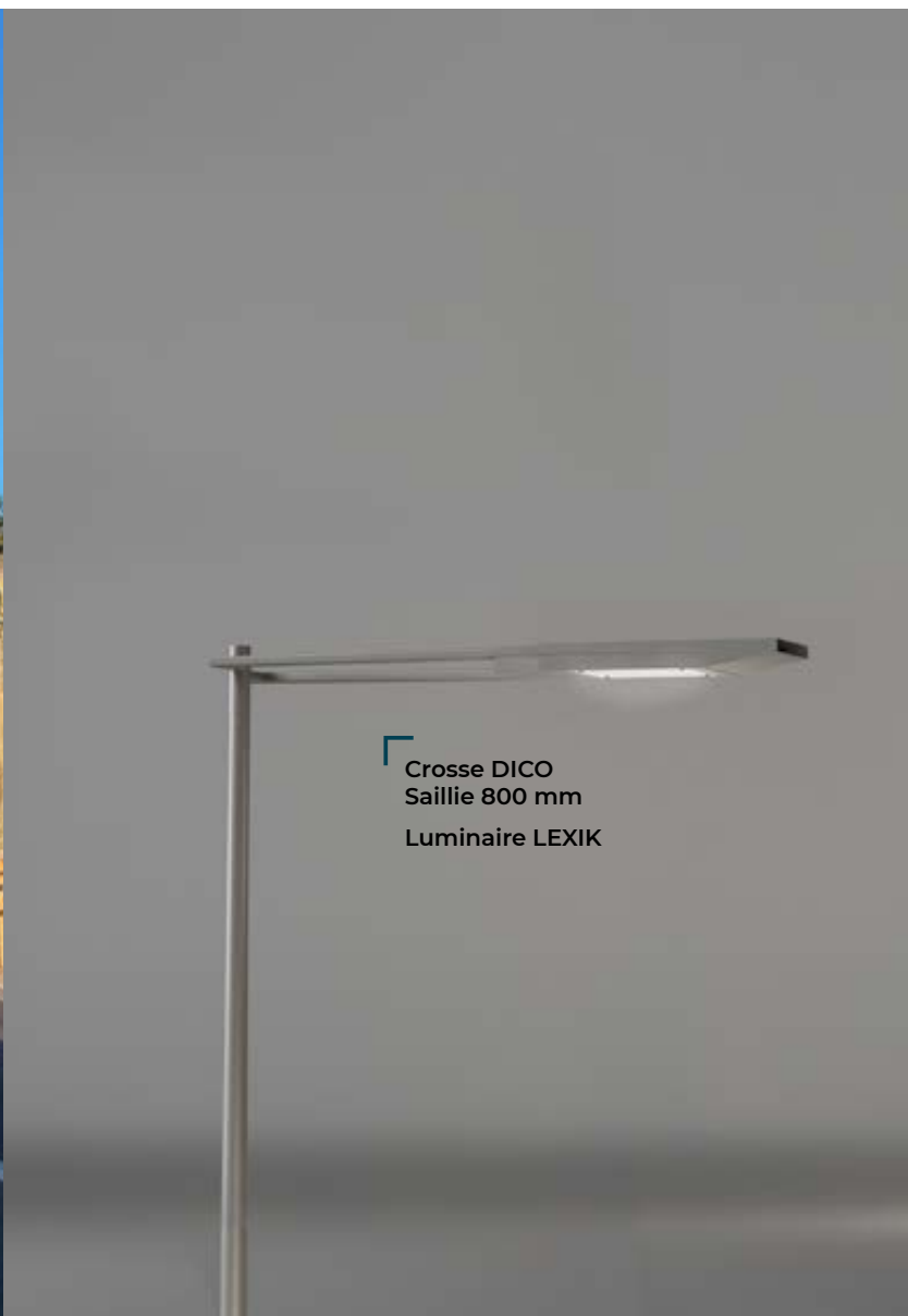
Crosse DICO Saillie 800 mm Luminaire LEXIK