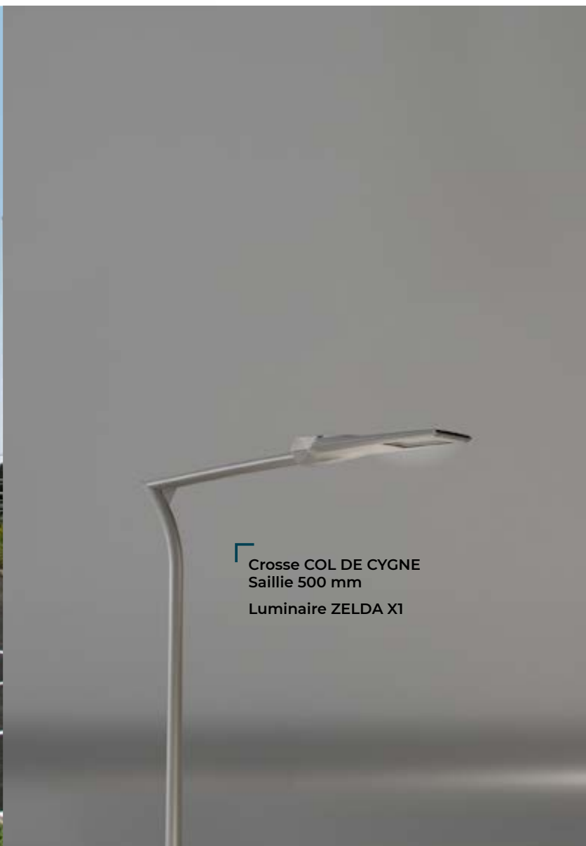
Crosse COL DE CYGNE Saillie 500 mm Luminaire ZELDA X1